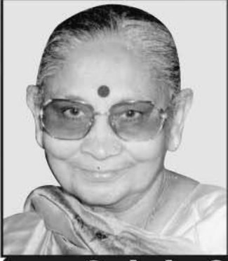
માતુશ્રી જયેશ્ઠેન વિજપાર ધનજી નિસર